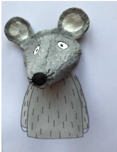
Tierkarte aus Eierkarton